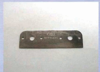
С80 имеет симметричную заточку При износе его можно переставить другой стороной

Установите захват на требуемый размер при помощи гайки * обязательно опустите лезвие во время настройки захвата