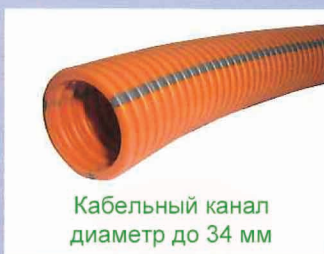
Кабельный канал диаметр до 34 мм