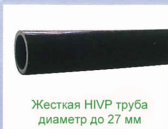
Жесткая NIPV труба диаметр до 27 мм

Наиболее подходящие для резки изделия и материалы