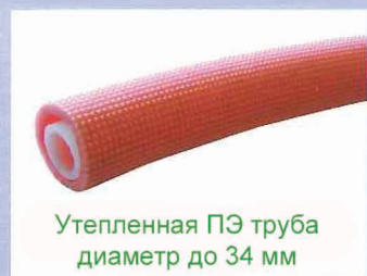
Утепленная ПЭ труба диаметр до 34 мм